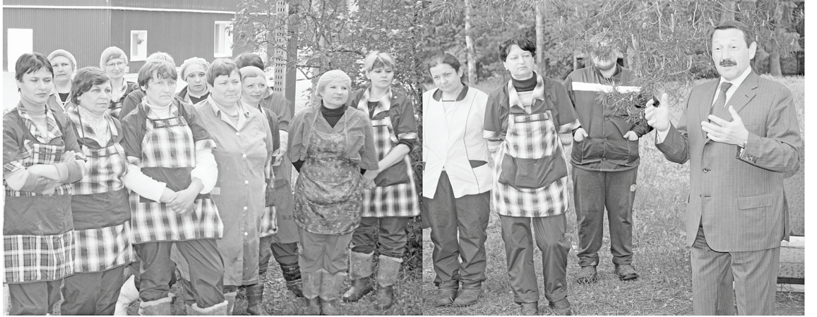
Встреча с коллективом Думиничского мясокомбината.

- пообещал Скляр. Постараемся поддержать «чугунку», достроить цементный завод, а это - налоги, деньги в районный бюджет, рабочие места.